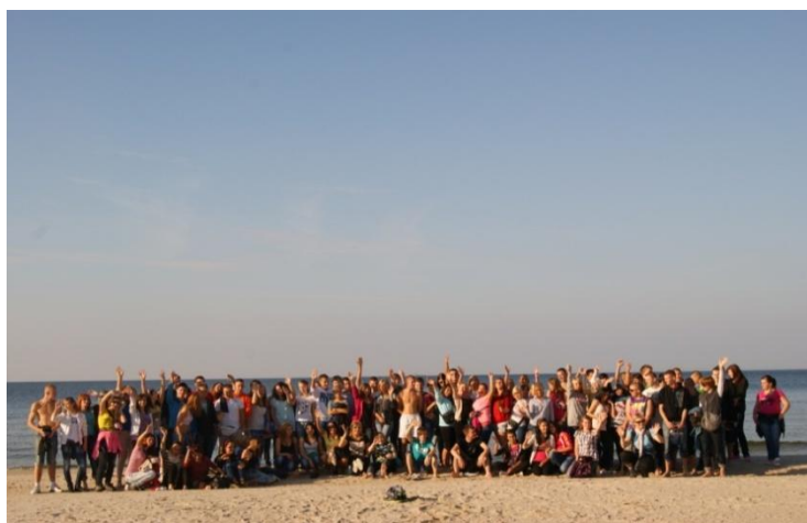
Fot. 26. Kąty Rybackie, wrzesień 2011. Obóz integracyjny.