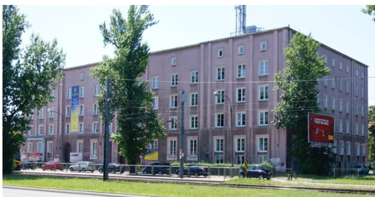
Fot. 2. Rok 2013. Budynek Zespołu Szkół im. Piotra Wysockiego przy ul. Odrowąża 75.