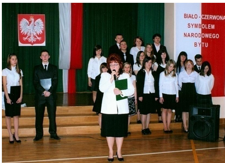
Fot. 25. Uroczysta inauguracja akcji „Biało-czerwona symbolem narodowego bytu”, 28. 04. 2010.