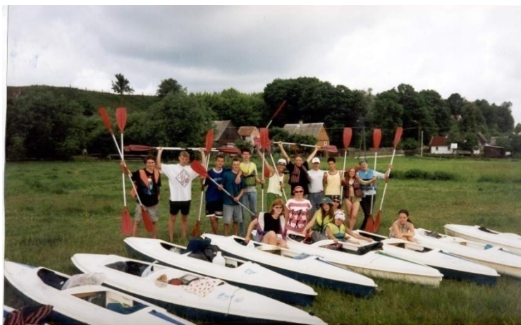
Fot. 19. Wycieczka kajakowa, lata dziewięćdziesiąte XX wieku.