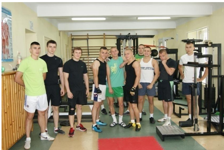
Fot. 33. Międzyszkolny Trójbój Siłowy 2012.