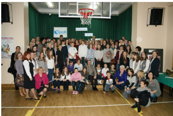
Fot.42. IV Dzielnicowe Dni Wolontariatu. Wolontariusze z Targówka.