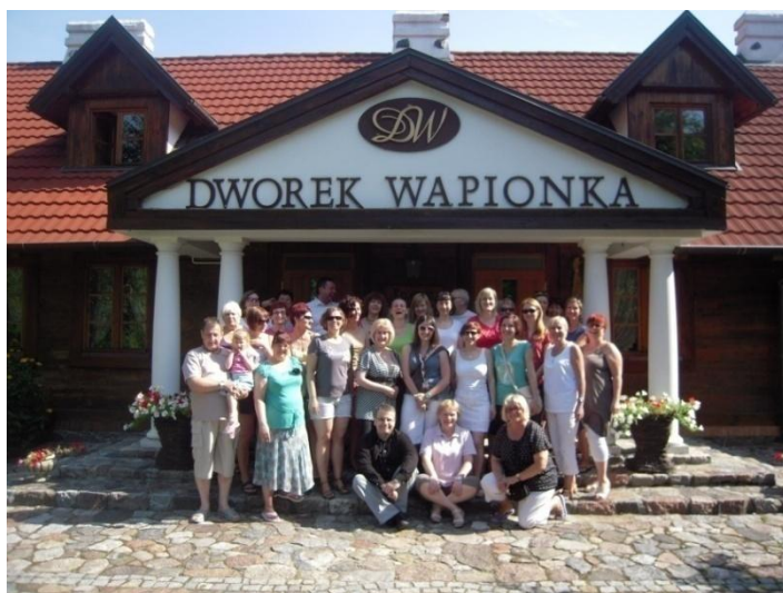
Fot. 37. Dworek Wapionka, Górzno. Grono pedagogiczne 2012/2013.