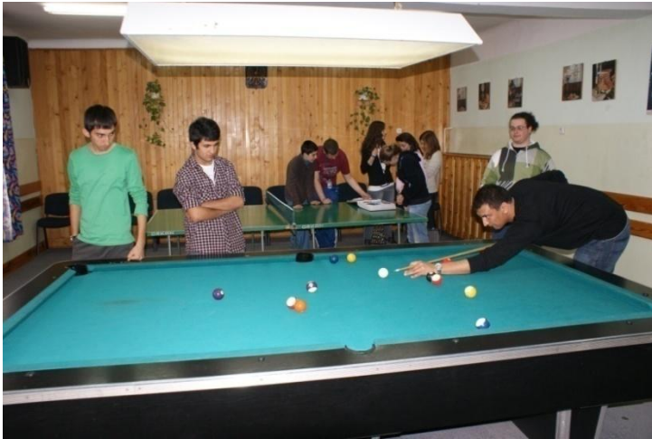
Fot. 21. Świetlica szkolna, marzec 2011. Uczestnicy Międzynarodowego Projektu „Kupiec wenecki – uczymy się międzykulturowej tolerancji” grają w bilard.