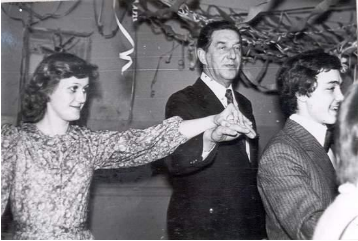
Fot. 9. Studniówka 1979.