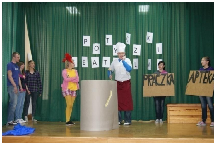
Fot. 30. Potyczki teatralne. Inscenizacja wiersza Jana Brzechwy Kaczka dziwaczka .