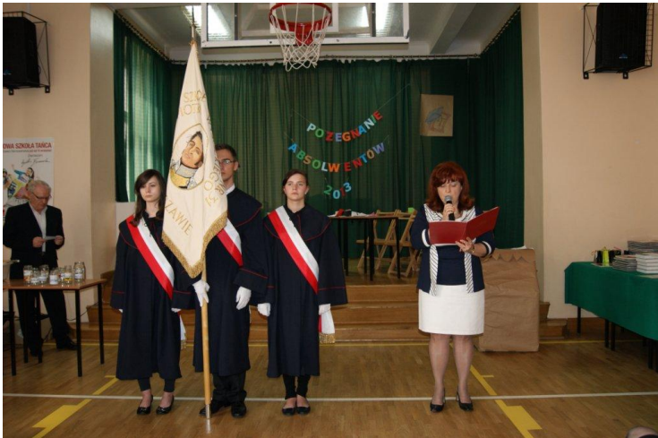
Fot. 32. „Ostatni Dzwonek” – pożegnanie maturzystów 2013.