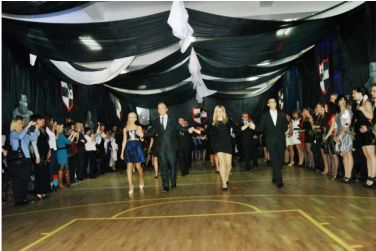
Fot. 31. Studniówka 2013.