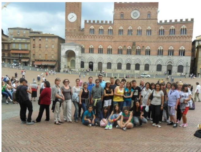
Fot. 36. Włochy, Marina di Carrara, maj 2011. Zakończenie Międzynarodowego Projektu „Kupiec wenecki – uczyliśmy się międzykulturowej tolerancji”.