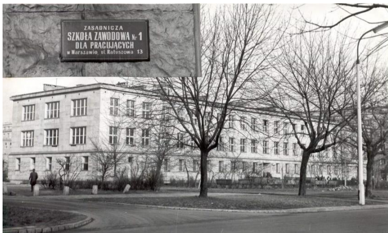
Fot.1. Pierwsza siedziba szkoły w budynku szkoły podstawowej przy ul. Ratuszowej 13.