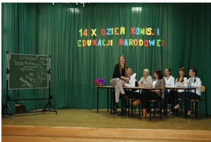
Fot. 23. Dzień Komisji Edukacji Narodowej, 14. 10. 2011.