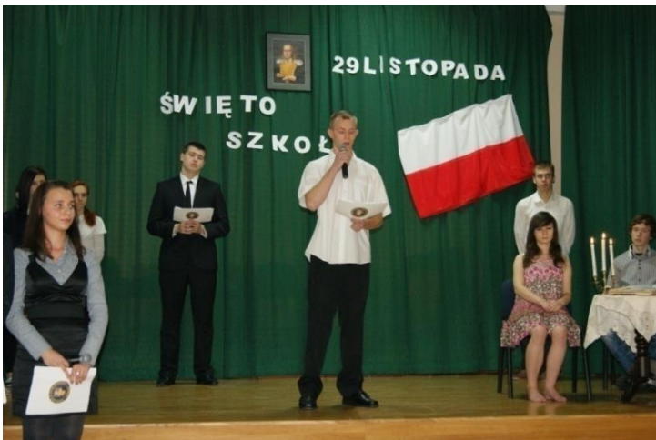
Fot. 22. Święto szkoły, 29. 11. 2011.