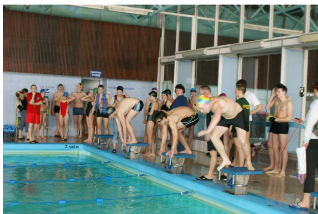
Fot. 18. Pływalnia przy ul. Namysłowskiej. Zawody pływackie o Puchar Dyrektora Zespołu Szkół im. Piotra Wysockiego.