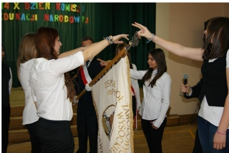
Fot. 24. Ślubowanie klas pierwszych, 14. 10. 2011.