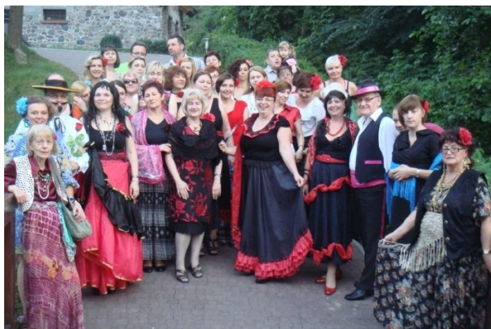
Fot. 38. Dworek Wapionka, Górzno. Spotkanie integracyjne.