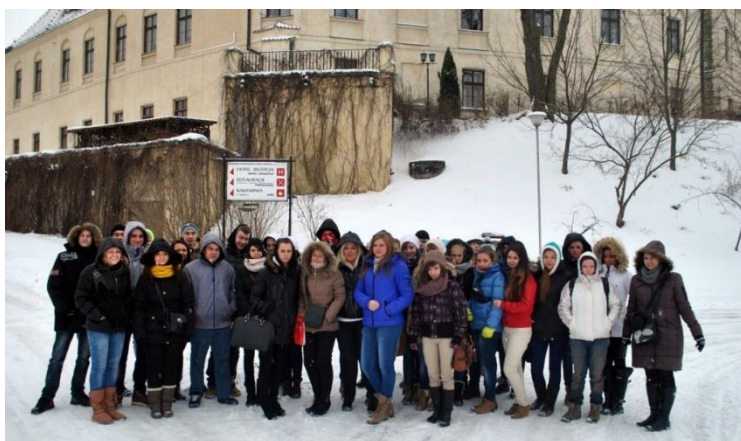
Fot. 34. Wycieczka do Pułtuska, grudzień 2012. Dom Polonii.