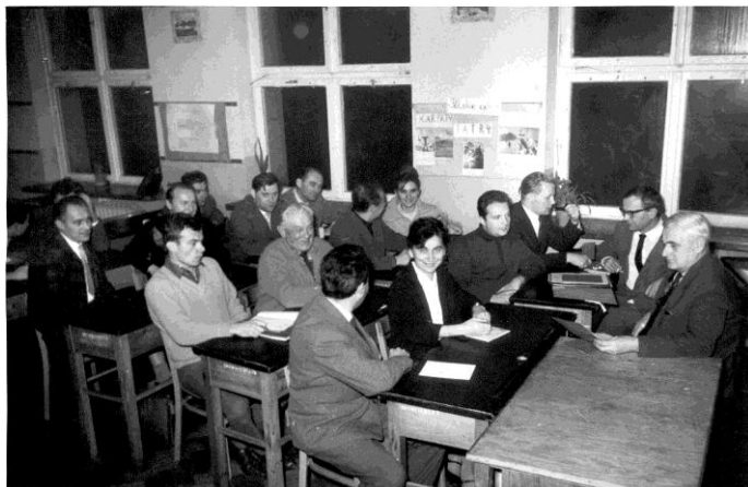
Fot. 7. Rok 1965. Posiedzenie Rady Pedagogicznej.