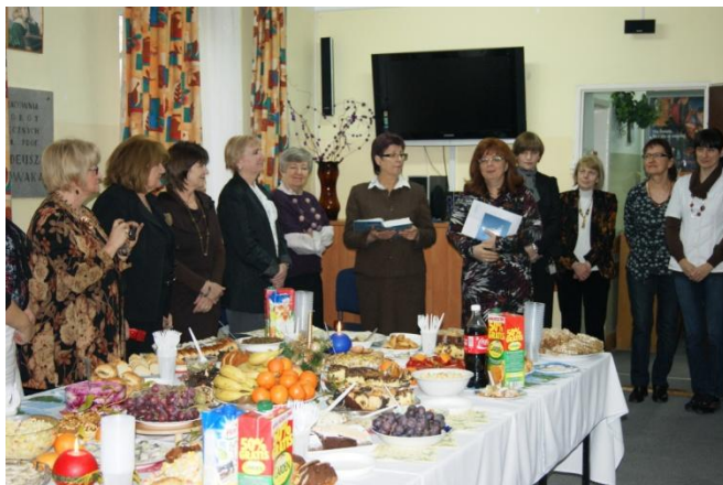
Fot. 13. Szkolna wigilia.